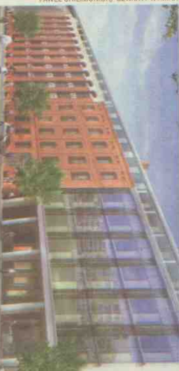
Tak będzie wyglądał hotel firmy Reier od ul. Wólczańskiej