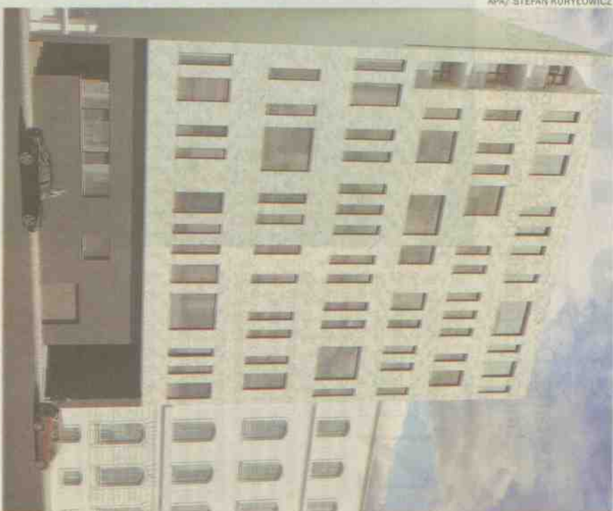
Nowa kamienica, którą Urbanica wzniesie przy ul. Wólczańskiej