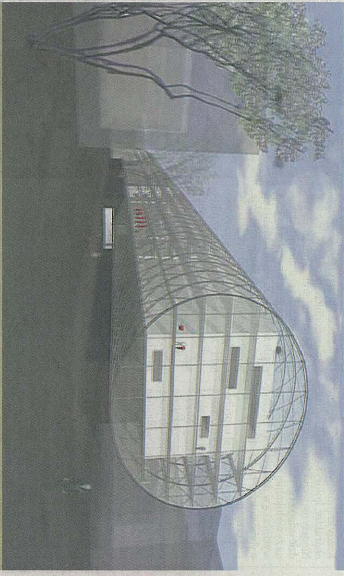
Zwycięski projekt Specjalnej Strefy Sztuki niemieckiego zespołu Chai'ego Muellera