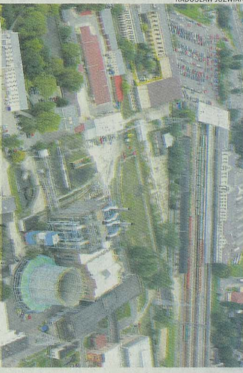
Dworzec Łódź Fabryczna i EC 1 - tu powstanie Nowe Centrum

czego edukacyjnego” i „poszukiwaniem nowych form architektury w ścisłym powiązaniu z tradycyjną zabudową śródmieścia Łodzi”. To jeden z ostatnich w Polsce zabudowywanych typów, który może stać się muzeum energii XX wieku.