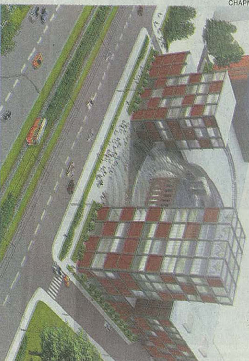
Wizualizacja Fabryki Biznesu z lotu ptaka