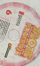
Cena „Gazety” i płyty CD 6,99 zł, w tym VAT

Złote przeboje - kolekcja hitów na lato na płytach CD - cz. 6.