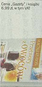
Cena „Gazety” i książki 6,99 zł, w tym VAT

Książki kucharskie Macieja Kuronia: cz. 2. - „Przetwory z owoców”