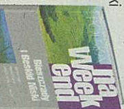
Cena „Gazety” i książki 5,99 zł, w tym VAT

Przewodniki po Polsce cz. 10. - Bieszczady i Beskid Niski