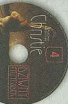
Cena „Gazety” i płyty CD 6,99 zł, w tym VAT

Agatha Christie Kryminały na lektre wieczory - czwarta z 5 płyt audio